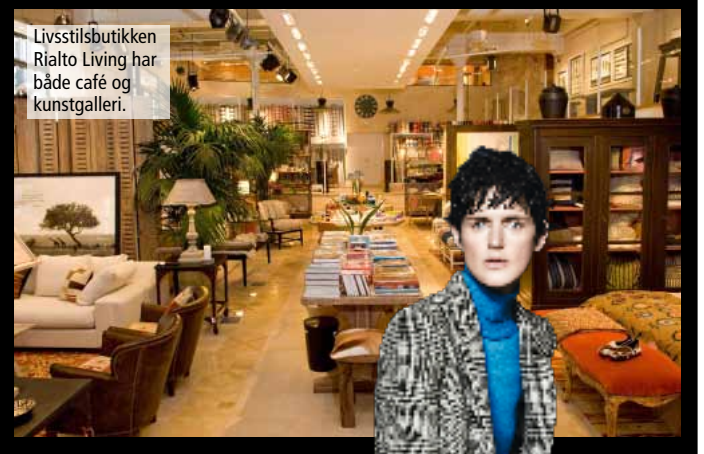
Livsstilsbutikken Rialto Living har både café og kunstgalleri.