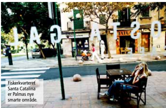
Fisker kvarteret Santa Catalina er Palmas nye smarte område.