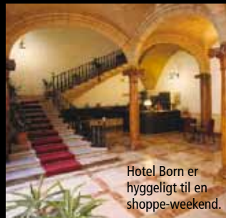
Hotel Born er hyggeligt til en shoppe-weekend.

“Der er mange rigtig lækre hoteller i Palma. Et godt bud er Santa Clara Hotel , som ligger i hjertet af Palmas gamle bydel. Du får ultimativ forkælelse i deres urban spa , og på tagterrassen findes den flotteste udsigt over Palma. I det tidligere Palacio de los Marqueses de Farrandel, som blev bygget i det 16. århundrede, ligger Hotel Born . Et simpelt, men dejligt sted, hvor du kan nyde din morgenmad i en typisk patio (gårdhave). Fantastisk sted at bo i en shopping-weekend. Hotel Convent de la Missió