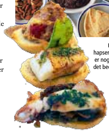
Uhm, hapseretter er noget af det bedste!

Pa amb oli – små brød med olie og lokale lækkerier.