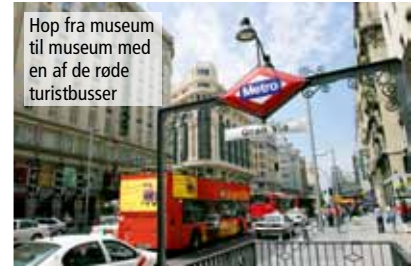
Hop fra museum til museum med en af de røde turistbusser