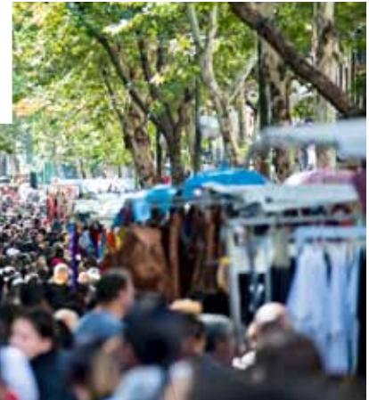
Flower power-stemning på El Rastro-markedet.