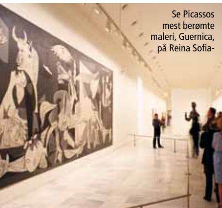
Se Picassos mest berømte maleri, Guernica, på Reina Sofia-