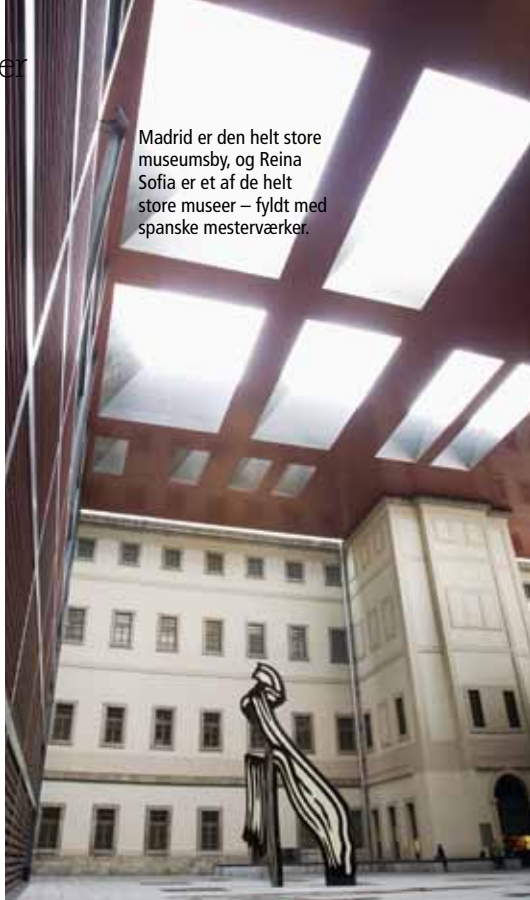
Madrid er den helt store museumsby, og Reina Sofia er et af de helt store museer – fyldt med spanske mesterværker.