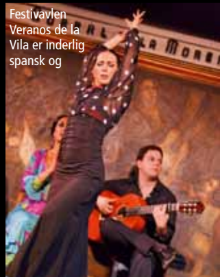
Festivallen Veranos de la Vila er inderlig spansk og

Veranos de la Vila veranosdelavilla.esmadrid.com